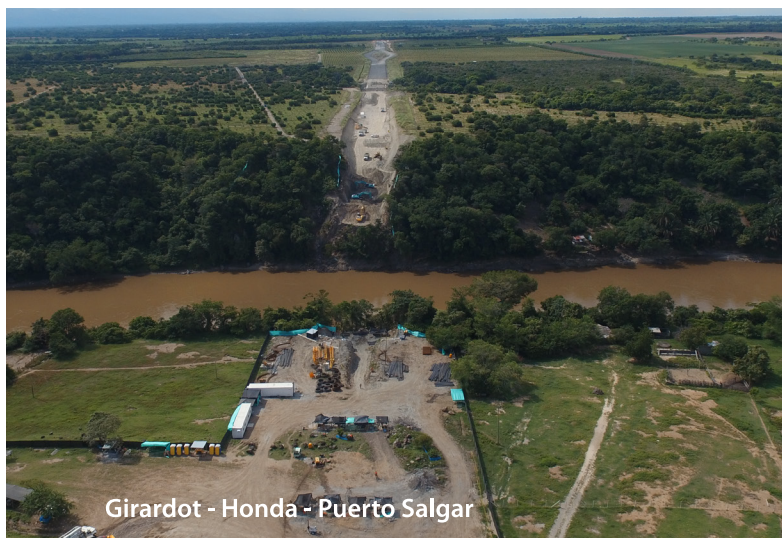
Girardot - Honda - Puerto Salgar

Cartagena - Barranquilla y Circunvalar de la Prosperidad