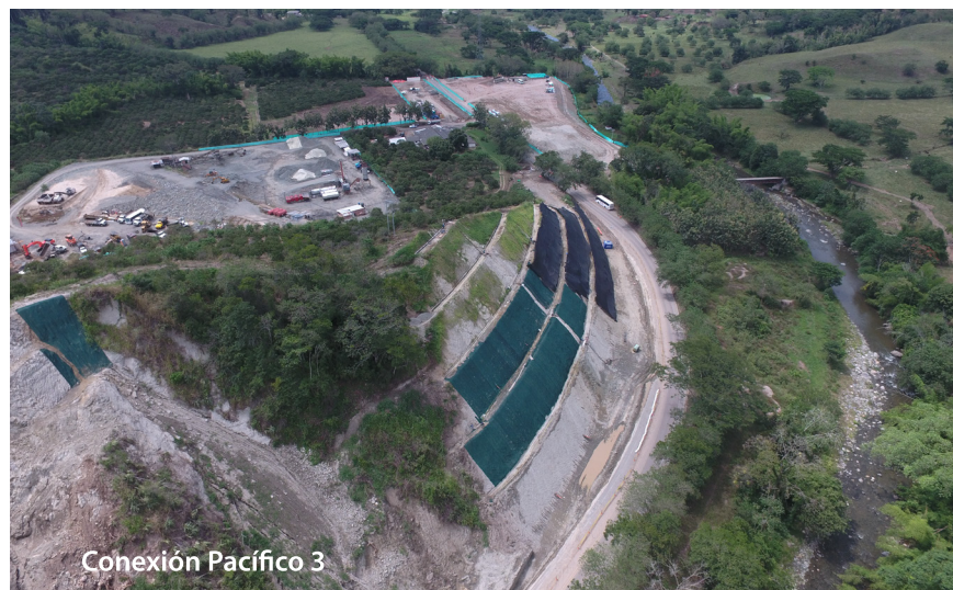
Conexión Pacífico 3

Consulta aquí nuestro Informe de Gestión 2011-2016: