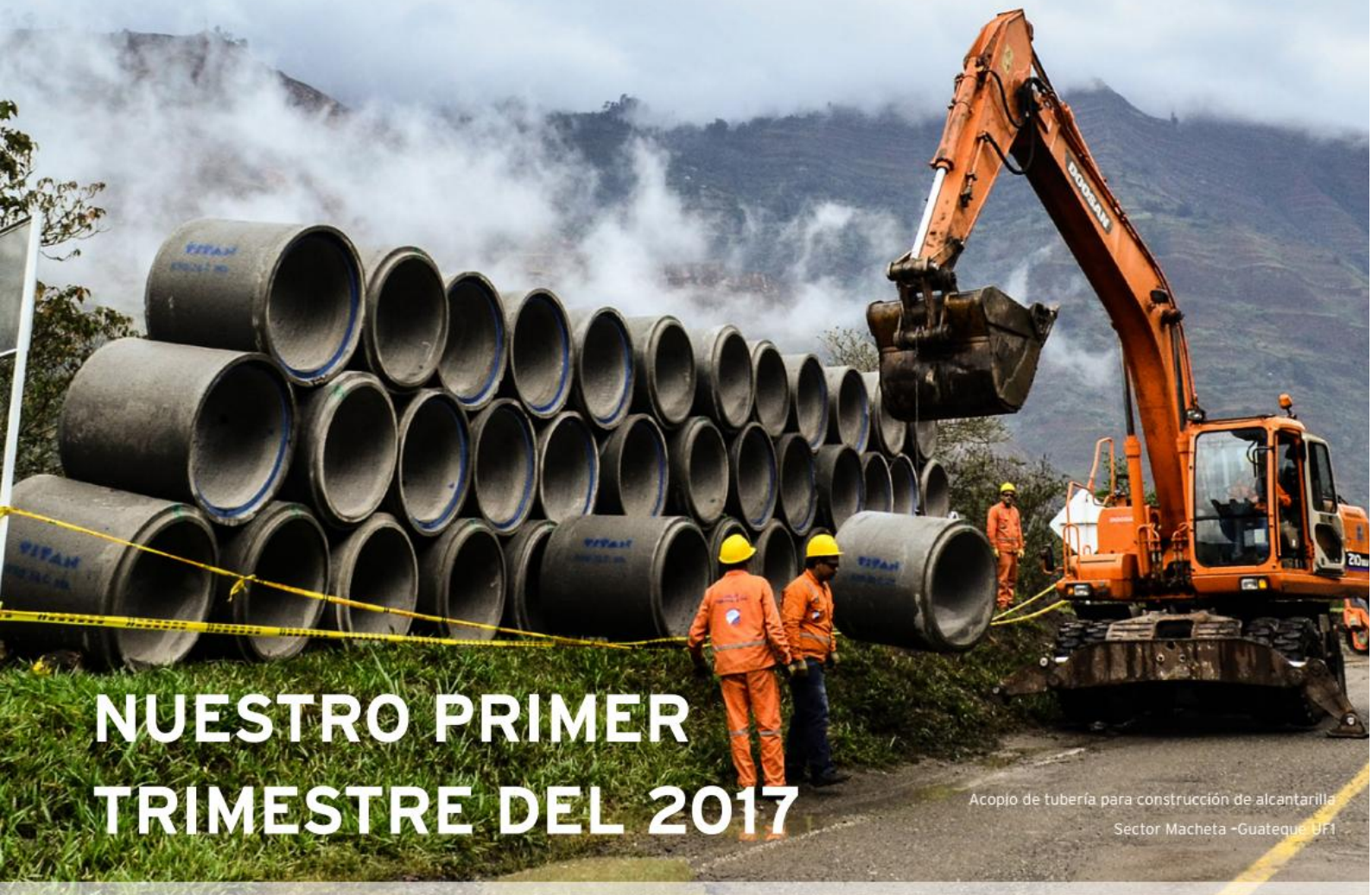
Acopio de tubería para construcción de alcantarilla Sector Macheta -Guateque UF1

Luego de cinco meses de arduo trabajo, hemos venido avanzando en la fase de construcción de la Unidad Funcional 1, tramo cuyo alcance es la rehabilitación de 49 kilómetros comprendidos entre el sector del Sisga y los municipios de Machetá, Manta y Guateque. A la fecha, cuenta con más de 12 frentes de obra simultáneos, alcanzando un avance de proyecto de más del 2%. Entre las obras que se vienen ejecutando se encuentra el reemplazo de 70 alcantarillas, atención de 6 sitios inestables y la construcción de 1500 metros lineales de filtros.