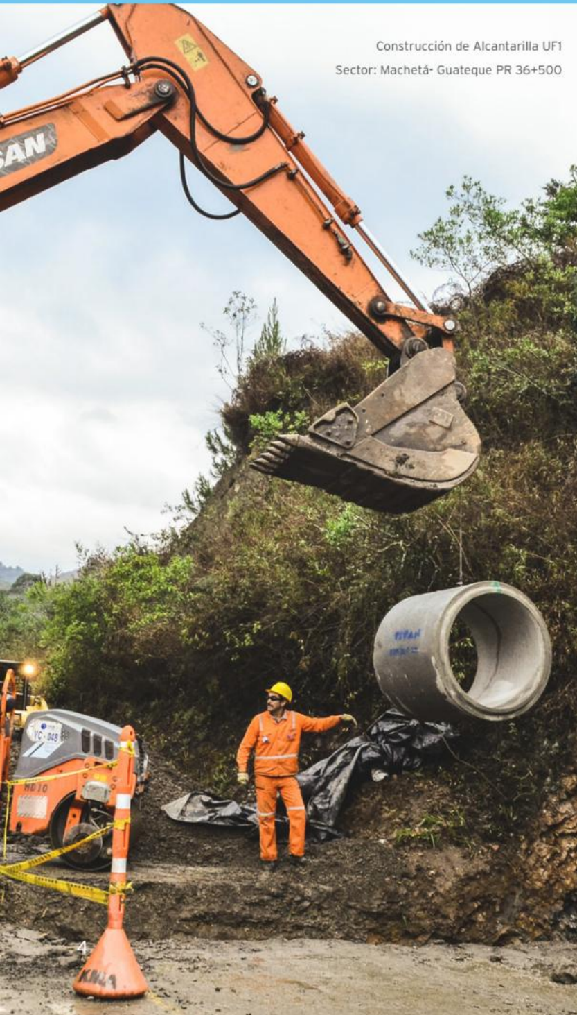
Construcción de Alcantarilla UF1 Sector: Machetá- Guateque PR 36+500

Durante todo el proceso de construcción deben realizarse diferentes trabajos para garantizar que los 137 kilómetros que componen el proyecto se desarrollen bajo los más altos estándares de calidad y se mantengan en perfectas condiciones en el largo plazo.