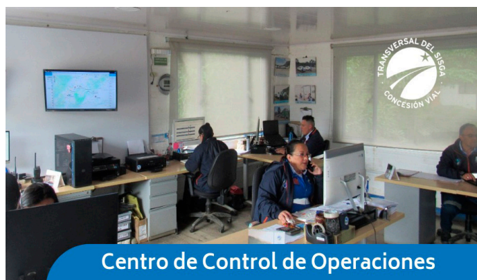
Centro de Control de Operaciones