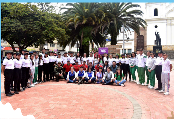
Celebración día Mundial del Medio Ambiente, Guatemala