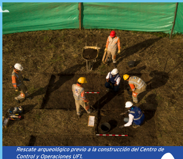
Rescate arqueológico previo a la construcción del Centro de Control y Operaciones UFI.