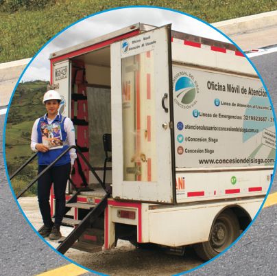
Oficinas Móviles de Atención al Usuario Semanalmente en diferentes puntos del corredor vial. Conozca su ubicación en nuestra página web www.concesiondelsisga.com.co