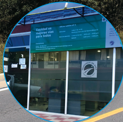
Oficina de atención UF4 San Luis de Gaceno - Boyacá Calle 4 # 5-04

Lunes a viernes de 8:00 a.m. a 6:00 p.m. sábados de 8:00 a.m. a 2:00 p.m.