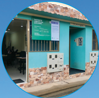
Oficina de atención UF1 Machetá - Cundinamarca Calle 4 #5-21