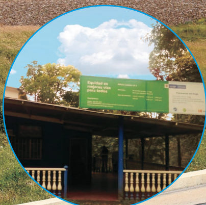
Oficina de atención UF3 Macanal - Boyacá Vereda La Vega