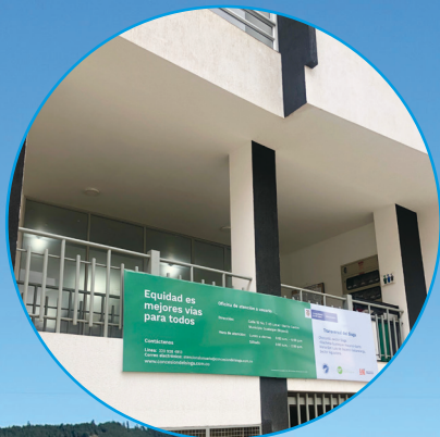
Oficina principal: Guateque - Boyacá Calle 10 # 7-65. Local 10