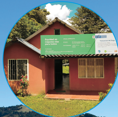
Oficina de atención UF2 Macanal - Boyacá Vereda El Dátil