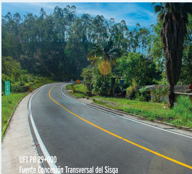
UF1 PR 29+000 Fuente Concesión Transversal del Sisga