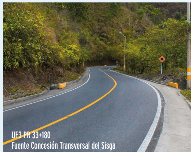
UF3 PR 33+180 Fuente Concesión Transversal del Sisga

Vertical: 1.440 unidades de señales instaladas Horizontal: 46 km