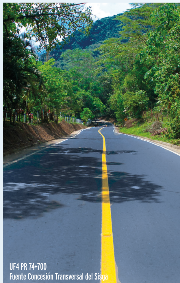
UF4 PR 74+700 Fuente Concesión Transversal del Sisga

Santa María - Aguacalara, 48 kilómetros: 95,98% de avance de obra