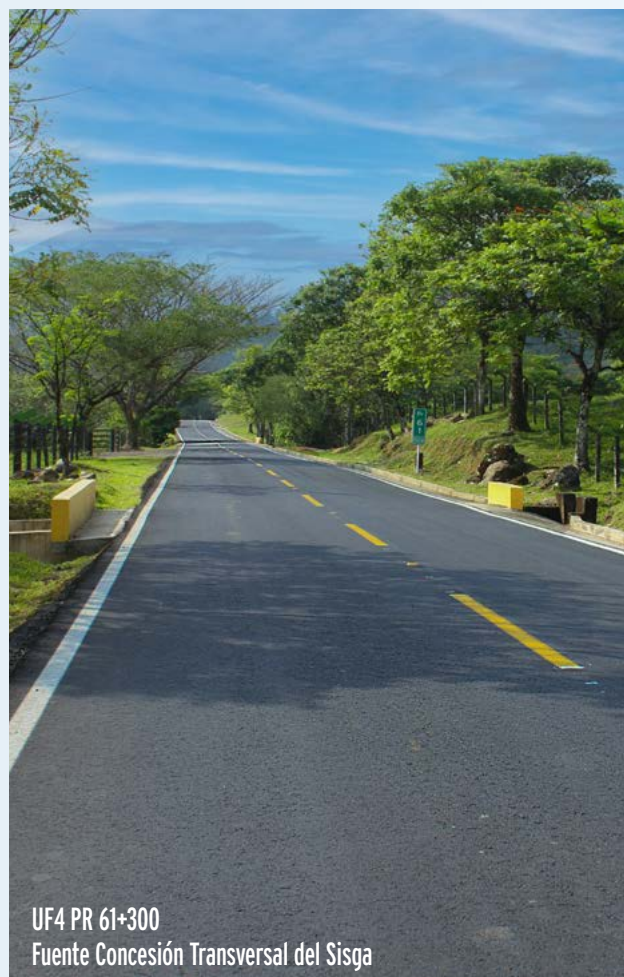
UF4 PR 61+300 Fuente Concesión Transversal del Sisga

Santa María - Aguacalara, 48 kilómetros: 95,98% de avance de obra