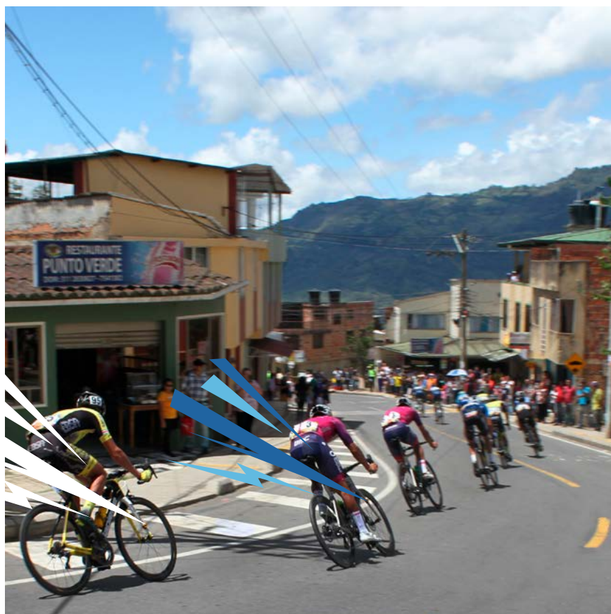
Tránsito de ciclistas por el Paso Urbano del municipio de Guateque UF1