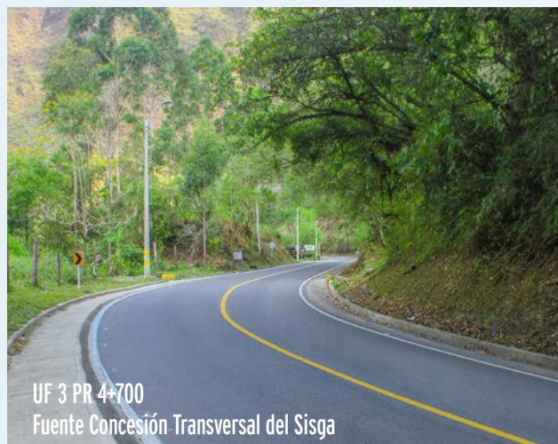
UF 3 PR 4+700

Sistema de control de tráfico túneles: (Instalado) Control que permite que dos camiones C3-S2 circulen con seguridad.