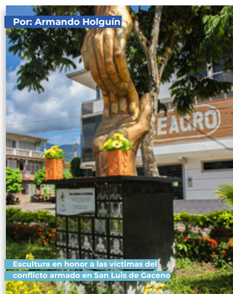
Por: Armando Holguín

Si desean conocer más sobre el arte de don Armando o contratar sus servicios, pueden comunicarse con él a través de los siguientes medios: