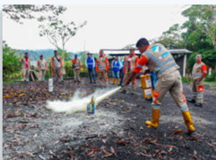
Capacitación en el manejo de extintores.