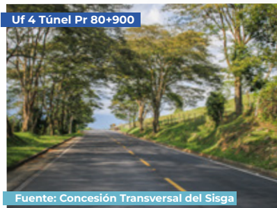
Uf 4 Túnel Pr 80+900

Sistema de control de tráfico túneles: (Instalado) Control que permite que dos camiones C3-S2 circulen con seguridad.