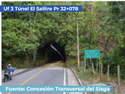
Uf 3 Túnel El Salitre Pr 32+078