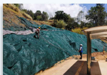
Acompañamiento a actividades de instalación de geomanto para estabilización de taludes.