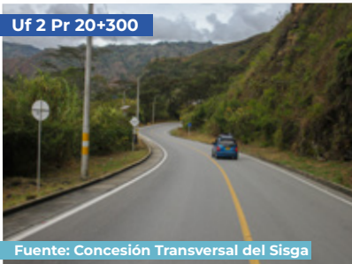
Uf 2 Pr 20+300

Sistema de control de tráfico de túneles: (Instalado) Control que permite que dos camiones C3-S2 circulen con seguridad.