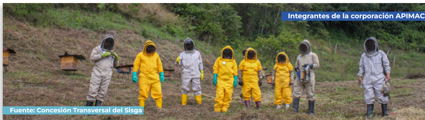
Integrantes de la corporación APIMAC