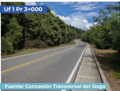
Uf 1 Pr 3+000