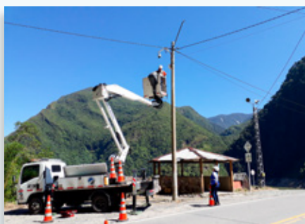
Acompañamiento a actividades de altura en el mantenimiento de cámara.

Su invaluable aporte, permite que día tras día se realicen las labores de operación y mantenimiento del corredor vial, así como las gestiones adelantadas desde las áreas ambiental, social y administrativa, bajo el menor riesgo de accidentes laborales posible.