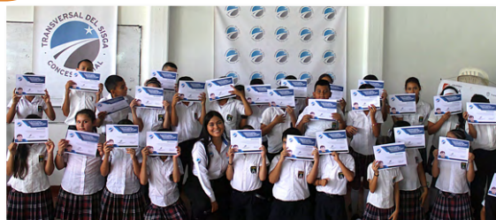
Institución Educativa San Luis de Gaceno (municipio San Luis de Gaceno).