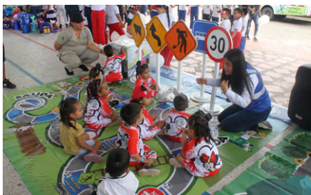
Coliseo cubierto del municipio de San Luis de Gaceno.

La Concesión Transversal del Sisga se vinculó y acompañó con actividades lúdico-pedagógicas la celebración del Día del Niño en los municipios de Santa María y San Luis de Gaceno. Juntos aprendimos, reímos y disfrutamos en el día más importante del año para los pequeños.