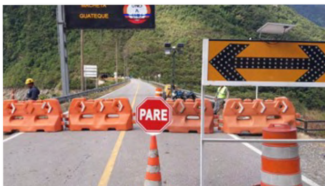
Demarcación de actividades.