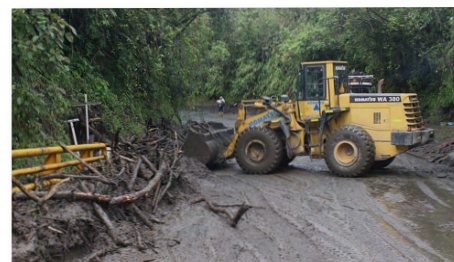
Sector puente Quebrada Honda.