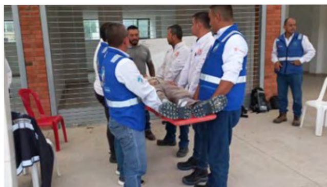
Capacitación Brigada De Emergencias al personal del pesaje SLG.