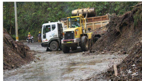
PR 32+100 Actividad de remoción de material sector túnel El Salitre.