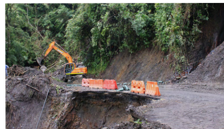
PR 34 +500 Pérdida de banca.