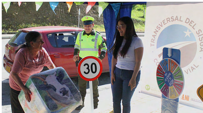
Paso seguro 10 municipio de Macanal.

Junto a las madres del Valle de Tenza compartimos un momento ameno de aprendizaje, obsequios y serenata.