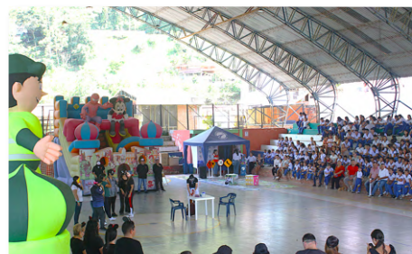
Coliseo cubierto del municipio Santa María.