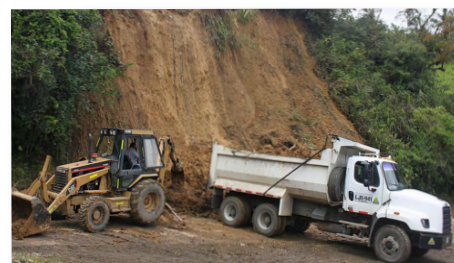
PR 29+300 Actividad de remoción de material.