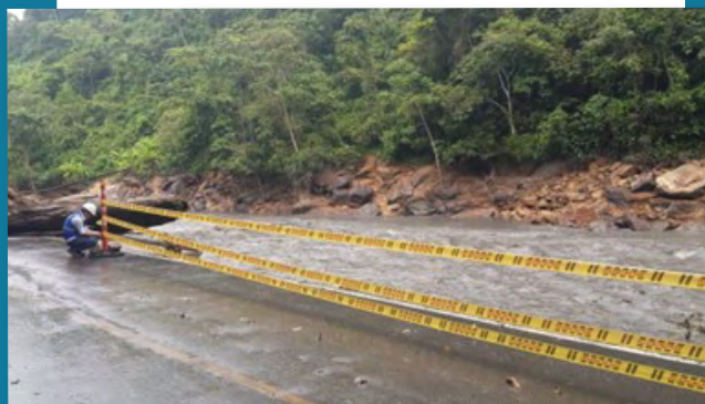
Señalización de zonas entre el PR56+000 al PR60+450 UF4.

Atendiendo las necesidades que surgieron a raíz de la emergencia, nuestro equipo de Seguridad y Salud en el Trabajo implementó medidas y prácticas para proteger la integridad física y mental de los trabajadores en su entorno laboral.