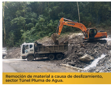
Remoción de material a causa de deslizamiento, sector Túnel Pluma de Agua.

Este arduo trabajo ha sido clave para garantizar que la Transversal del Sisga siga operando de manera eficiente, brindando una vía segura y confiable para todos.