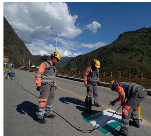
Mantenimiento de puentes vehiculares