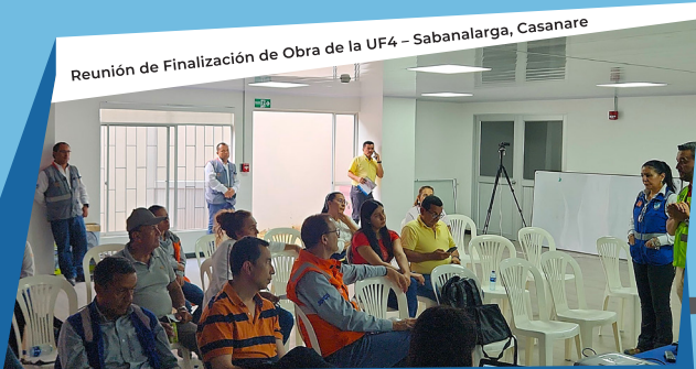
Reunión de Finalización de Obra de la UF4 – Sabanalarga, Casanare