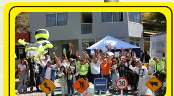
Campana de Seguridad vial sector la Esmeralda Sutatenza, Boyacá.