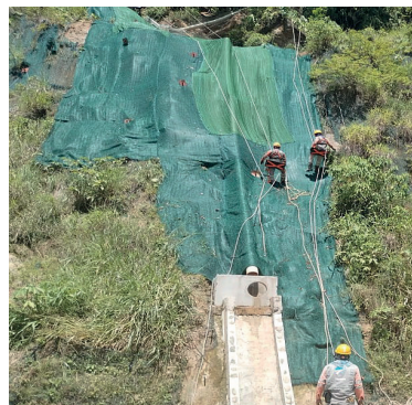
Mantenimiento de taludes