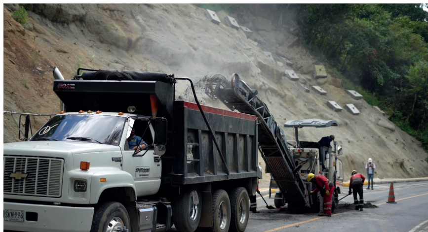
Mantenimiento de carpeta de rodadura PR32+200, UFI