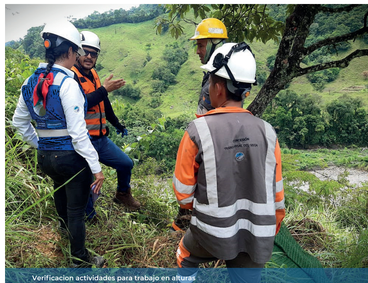
Verificación actividades para trabajo en alturas