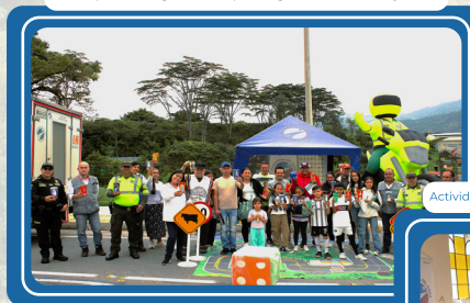
Campana de Seguridad vial paso seguro 10 Macanal, Boyacá.