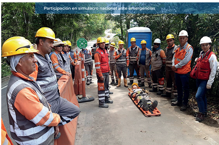
Participación en simulacro nacional ante emergencias