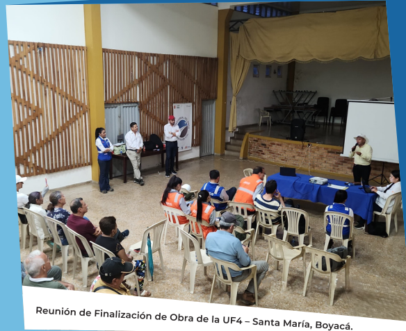
Reunión de Finalización de Obra de la UF4 – Santa María, Boyacá.

Avanzamos hacia un futuro más conectado y próspero para la región