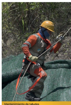
Mantenimiento de taludes