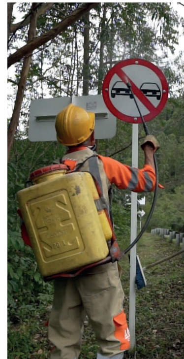
Lavado de tableros de señales verticales