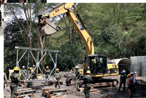
Inicio de obras del puente metálico modular