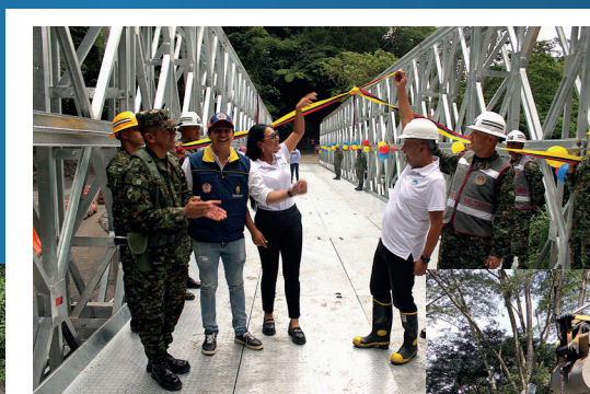
Puesta en operación del puente metálico modular