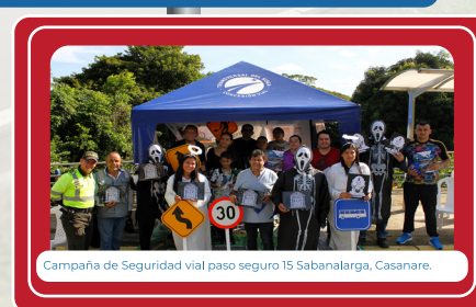
Campana de Seguridad vial paso seguro 15 Sabanalarga, Casanare.