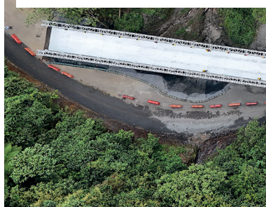
Panorámica del puente metálico modular