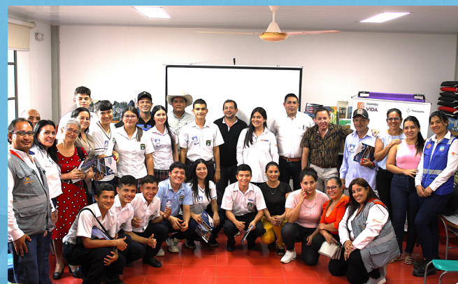
Seminario "Formulación, gestión y evaluación de proyectos" con la ESAP, en San Luis de Gaceno, Boyacá.

¡Uniones y esfuerzos que transforman comunidades!