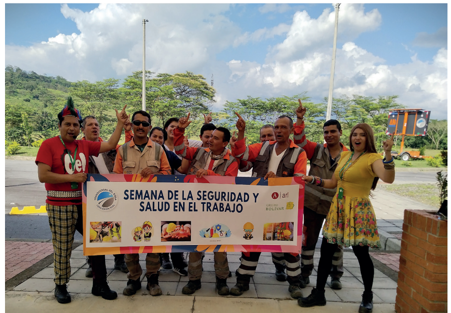
Campaña de seguridad y salud en el trabajo riesgo ergonómico