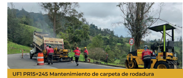
UFI PR15+24S Mantenimiento de carpeta de rodadura