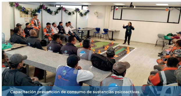
Capacitación prevención de consumo de sustancias psicoactivas

Desde el área de Seguridad y Salud en el Trabajo, seguimos garantizando la seguridad y el bienestar de los colaboradores, a través de la identificación de riesgos laborales y la implementación de medidas preventivas. De esta forma, promovemos un entorno laboral positivo entre nuestro personal.