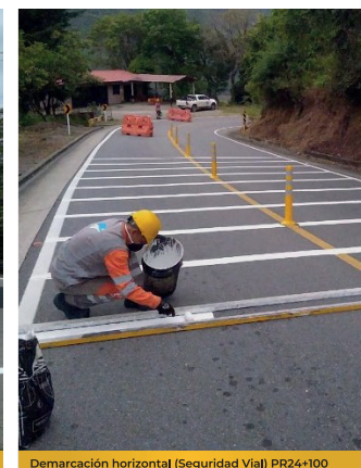
Demarcación horizontal (Seguridad Vial) PR24+100