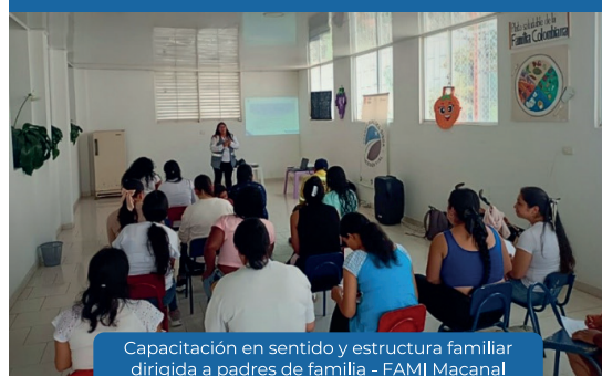
Capacitación en sentido y estructura familiar dirigida a padres de familia - FAMI Macanal