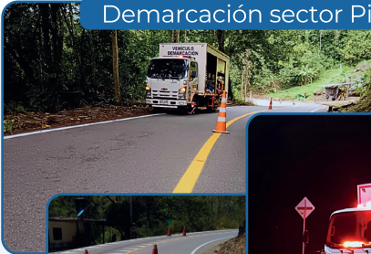
Demarcación sector Piedra Campana

Para el mes de abril, se tiene programada la fundición de la placa de tablero y la instalación de barandas con empalmes de andén en ambos costados, fortaleciendo la infraestructura y seguridad del puente.