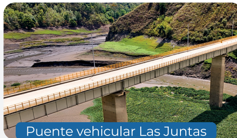
Puente vehicular Las Juntas

El concesionario permanentemente realiza mantenimiento preventivo y rutinario a las estructuras de los 39 puentes vehiculares con los que cuenta el corredor vial, asegurando así, la seguridad a nuestros usuarios. En las fotografías se registra los dos puentes más largos del corredor: Puente Las juntas y Puente del río Upía, estructuras claves en la conexión del corredor.