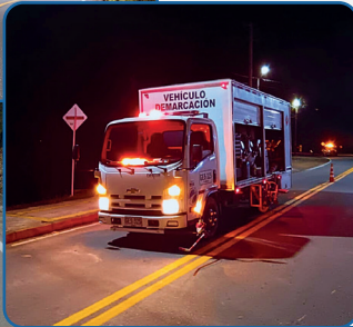
Actividades nocturnas de demarcación