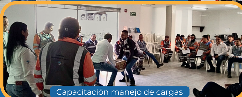
Capacitación manejo de cargas