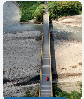
Puente vehicular Río Upía