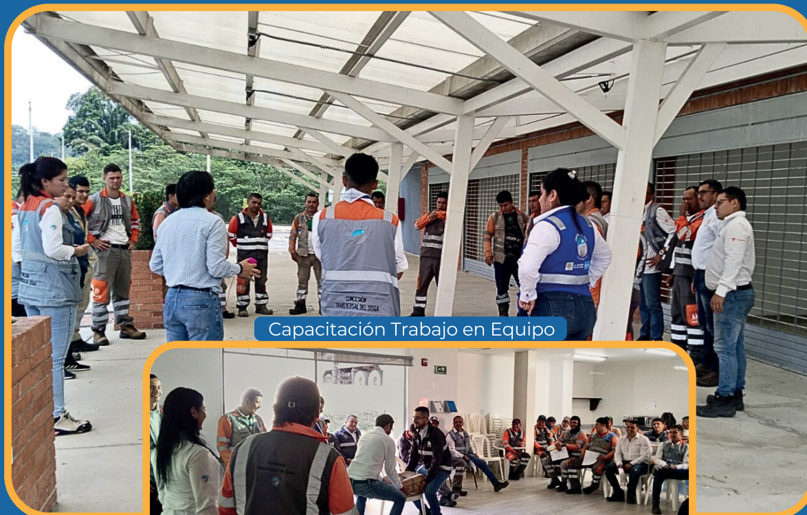
Capacitación Trabajo en Equipo

La Seguridad y Salud en el Trabajo para nosotros es muy importante, por eso trabajamos continuamente para proteger a nuestros colaboradores, identificando riesgos y aplicando medidas preventivas efectivas. Nuestro compromiso es crear un entorno seguro y saludable que impulse el bienestar y la productividad de todo el equipo.