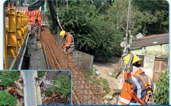
Puente El Toro (vista superior)