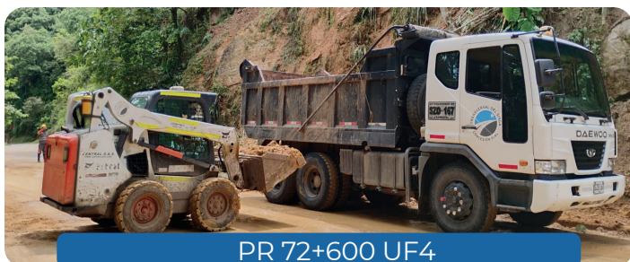
PR 72+600 UF4