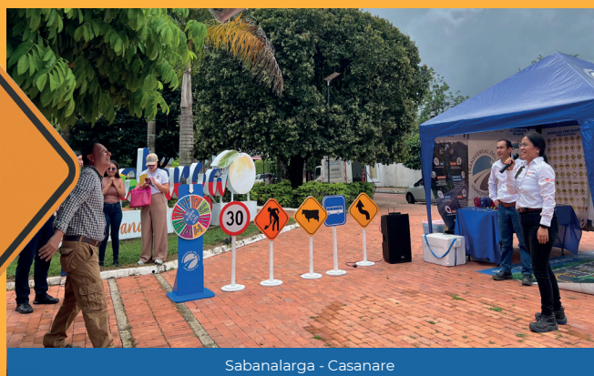
Sabanalarga - Casanare