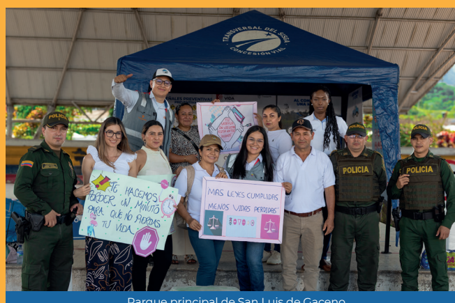
Parque principal de San Luis de Gaceno