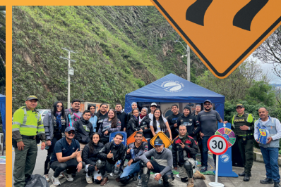
Paso seguro 9-sector Las Juntas