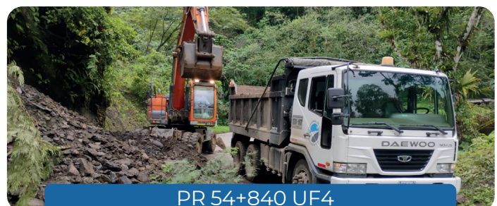
PR 54+840 UF4