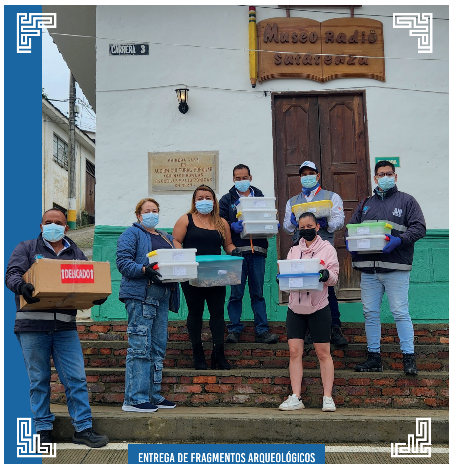
ENTREGA DE FRAGMENTOS ARQUEOLÓGICOS MUSEO RADIO SUTATENZA.

Estas acciones ratifican la responsabilidad de la Concesión con la preservación del patrimonio arqueológico, el cual representa los relatos de vida de nuestros antepasados y enriquece la memoria colectiva de la región.