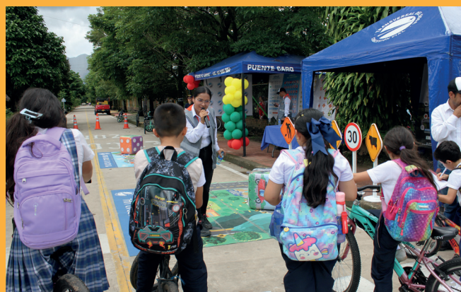
Sabanalarga - Casanare.