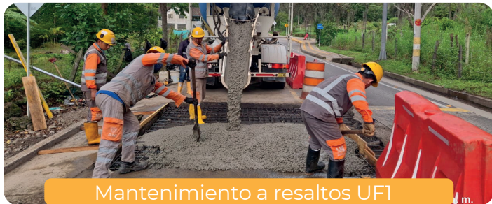
Mantenimiento a resaltos UF1

Estas labores reflejan nuestro compromiso con el bienestar de todos los usuarios que recorren esta importante vía. Seguiremos trabajando con dedicación para ofrecer un corredor vial en óptimas condiciones, contribuyendo al desarrollo regional y a la seguridad vial.