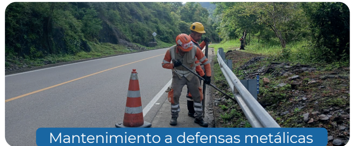
Mantenimiento a defensas metálicas