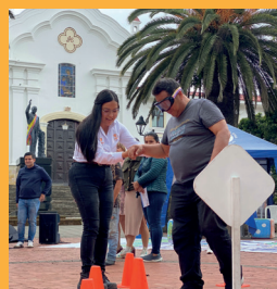
Parque principal - Guateque.