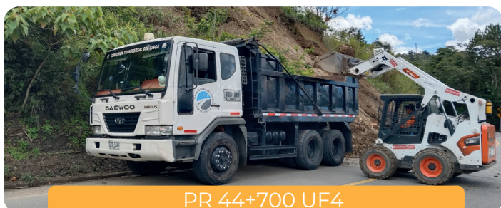
PR 44+700 UF4