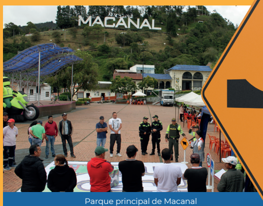
Parque principal de Macanal