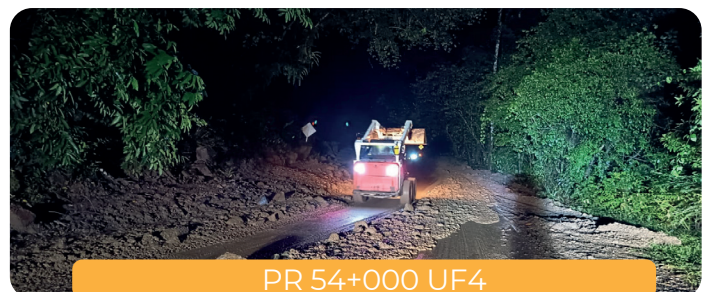
PR 54+000 UF4