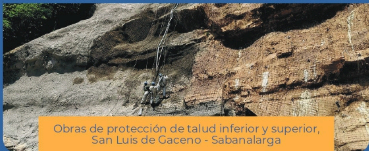
Obras de protección de talud inferior y superior, San Luis de Gaceno - Sabanalarga