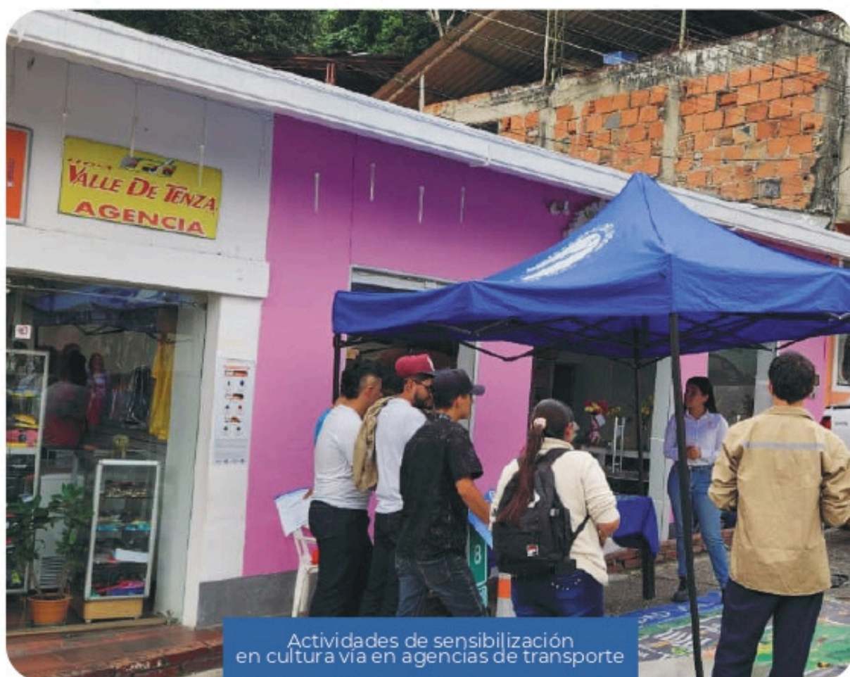
Actividades de sensibilización en cultura vial en agencias de transporte