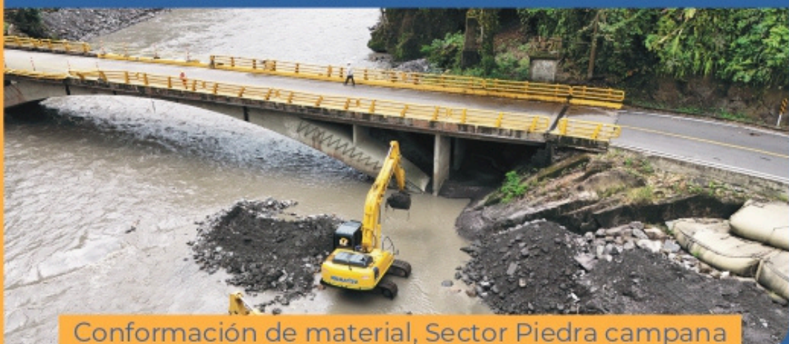
Conformación de material, Sector Piedra campana