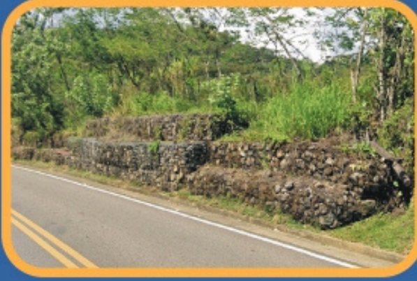
REPARACIÓN DE MUROS EN GAVIÓN SAN LUIS DE GACENO - PR 74+600 UF4