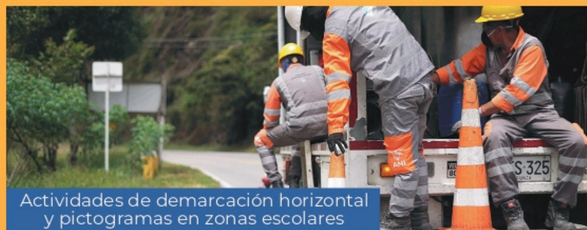
Actividades de demarcación horizontal y pictogramas en zonas escolares