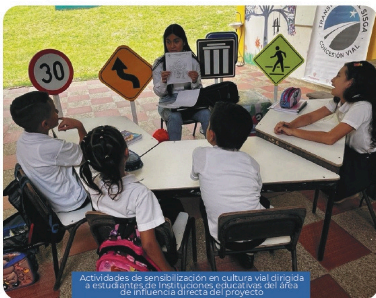
Actividades de sensibilización en cultura vial dirigida a estudiantes de Instituciones educativas del área de influencia directa del proyecto