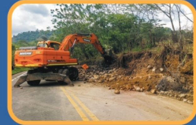
REPARACIÓN DE MUROS EN GAVIÓN SAN LUIS DE GACENO - PR 74+600 UF4