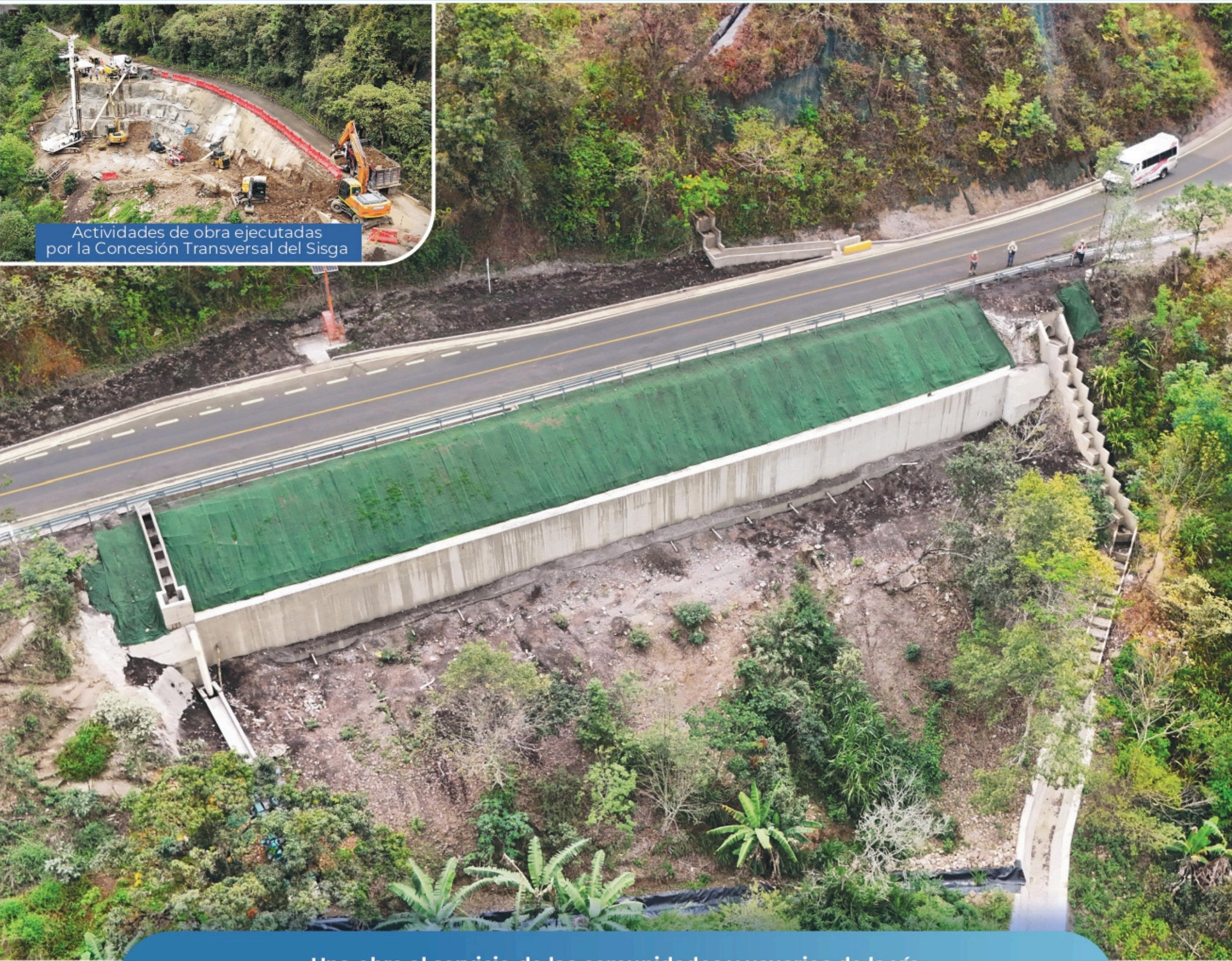
Actividades de obra ejecutadas por la Concesión Transversal del Sisga