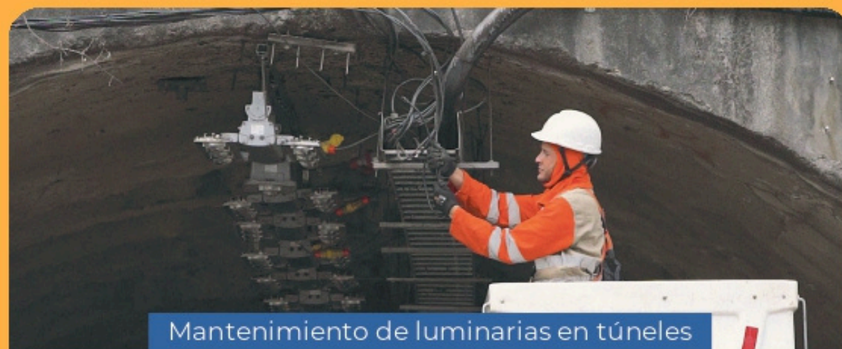
Mantenimiento de luminarias en túneles