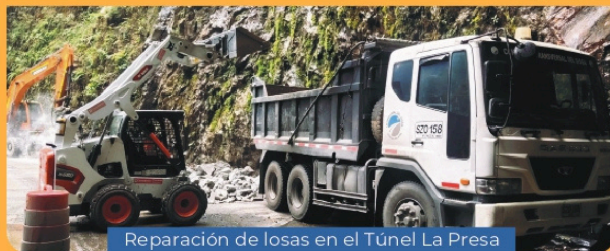
Reparación de losas en el Túnel La Presa